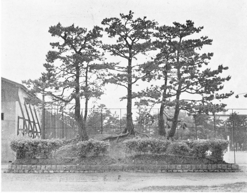
調 査 着 手 前 の 鶴 塚 (昭 和 三 十 年 六 月 上 旬)