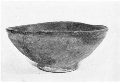
鶴 塚 小 堅 穴 出 土 瓦 器