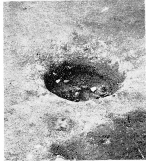
鶴 塚 小 堅 穴