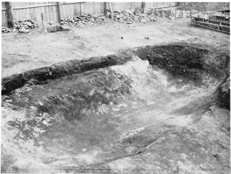
鶴 塚 掘 込 部